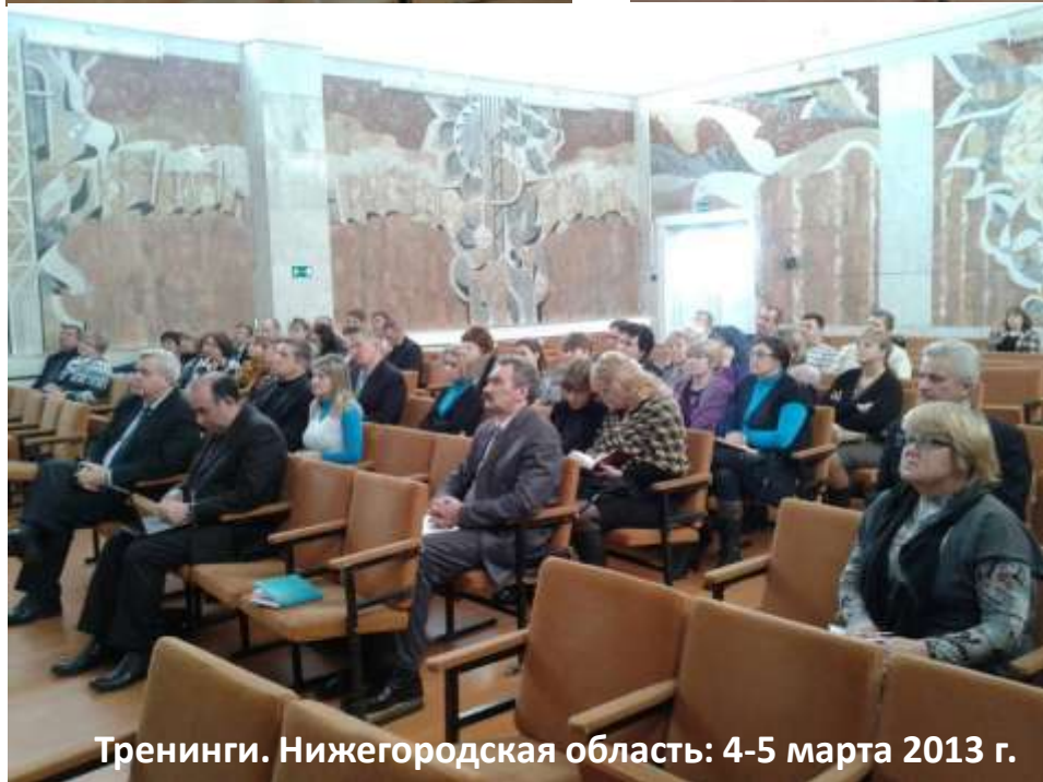
Тренинги. Нижегородская область: 4-5 марта 2013 г.